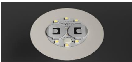
薄い円盤状に LED・電池などを配置

ライトパッドは、薄型の LED をボタン電池で光らせる丸い平板の電子デバイスで、ボトルやグラスの底面に貼り付けて使います。